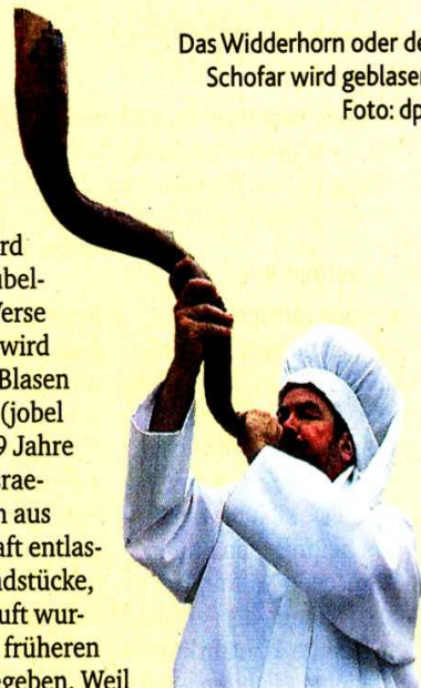
Das Widderhorn oder der Schofar wird geblasen.

Nur Jesaja spricht vom „Gnadenjahr“. Damit bezieht sich der Verfasser auf das 25. Kapitel im Buch Levitikus. Dort wird das Jobel- oder Jubeljahr vorgestellt (Verse 8-13.23-31) - es wird eröffnet mit dem Blasen des Widderhorns (jobel = Widder). Alle 49 Jahre sollen verarmte Israeliten unentgeltlich aus Schuldknechtschaft entlassen werden; Grundstücke, die aus Not verkauft wurden, werden dem früheren Besitzer zurückgegeben. Weil Gott die Israeliten aus der Sklaverei befreit hat, sollen diese nicht in Schuldklaverei gehalten werden. Deshalb gelten das Jubeljahr wie das Gnadenjahr als Zeit des Heils. (brk)